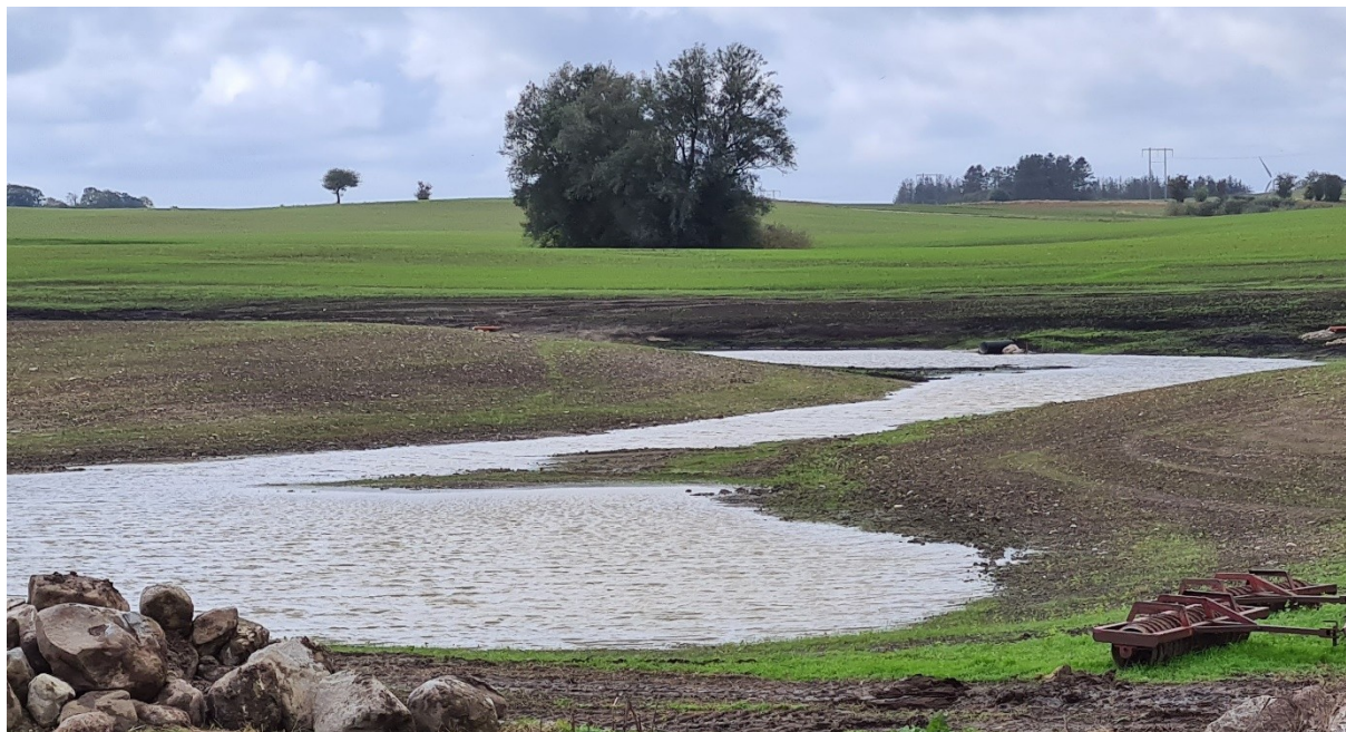
Den nyanlagda våtmarken "Ådala södra" fylls på med dräneringsvatten från den omgivande åkermarken.