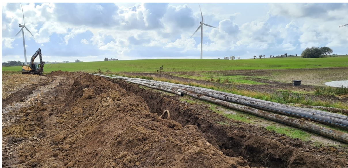
Rörledningen mellan Sillesjödammarna och sockerbruket(fd) tas bort.