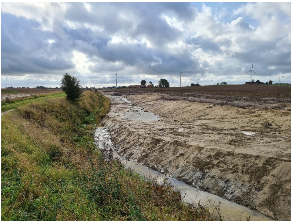
Tvåstegsdike uppströms Ådala.